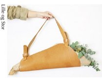
Lille og Stor